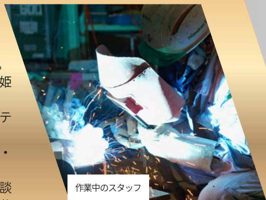
作業中のスタッフ