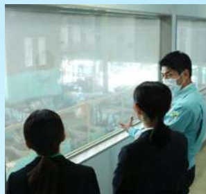
▲工場見学イメージ

「工場見学」「社長座談会」「文化体験」など、盛りだくさんのコンテンツで当社への理解が深まること間違いなし！ご応募お待ちしております！